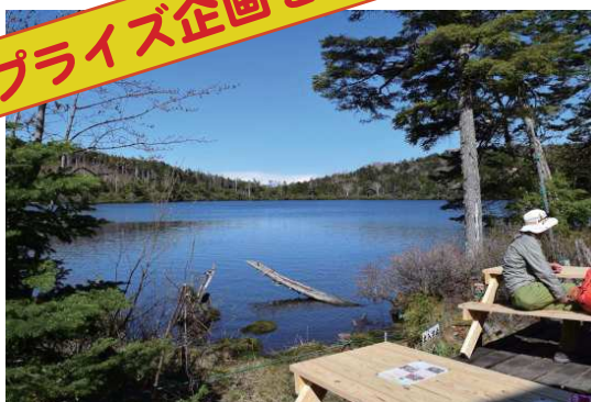
麦草峠近くの白駒の池