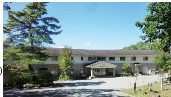
東京家政学院蓼科山の家

Mail: saitama@camping.or.jp 主催：NPO 法人埼玉県キャンプ協会（TEL 080 8729 0349）